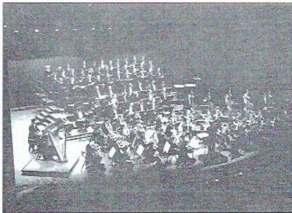
La Orquesta de los Campos Elíseos, durante un concierto.

Philippe Herreweghe. Desde sus inicios, el objetivo de la formación está en la interpretación del repertorio clásico y romántico con instrumentos de época. Siguiendo a una fase de residencia en el propio teatro parisino y en el Palacio de Bellas Artes de Bruselas, la formación ha actuado en los más destacados auditorios europeos, desde el Musikverein de Viena, Concertgebouw de Amsterdam, Barbican de Londres, Philharmonie de Berlín o Gewandhaus de Leipzig, entre otros muchos. Además, ha realizado giras por Australia y Asia, siempre con programas centrados en la música francesa. Su intenso programa concertístico se complementa con numerosas grabaciones que han recibido mencio-