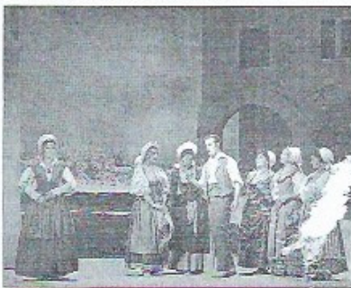
Representación de la obra.