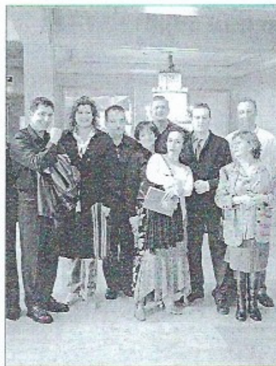
El reparto, antes de iniciar la rueda de prensa, en el Campoamor.