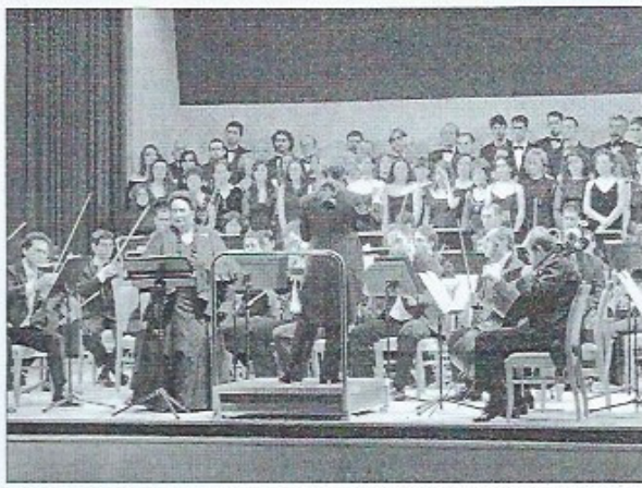
La orquesta, el coro y la soprano Montserrat Caballé, durante el concierto inaugural del Auditorio de Elda.

La Orquesta Sinfónica «Ciudad de Oviedo» (OSCO) ofreció el pasado jueves un concierto en la localidad allicantina de Elda acompañando a la prestigiosa soprano Montserrat Caballé, bajo la dirección de Pilar Vañó y con la participación del orfeón «Voces Crevillentinas». Tanto la soprano como la formación ovetense obtuvieron un gran éxito en la jornada inaugural del nuevo equipamiento de Elda, un auditorio de tamaño medio cuya programación estará dedicada a conciertos sinfónicos y ópera.